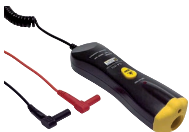
Sonde tachymétrique sans contact CA 1711 pour les mesures de vitesse de rotation (de 6 à 120 000 RPM)