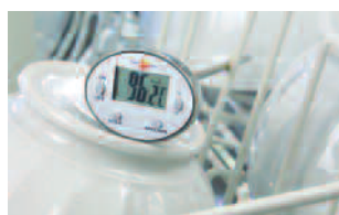
Mesure de température ambiante.