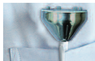
Support/protection. Toujours à portée de main.