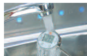
Nettoyage du mini-thermomètre par simple rinçage sous l'eau.