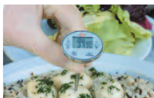
Mesure de la température en alimentaire.