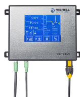
Optidew 501 Hygromètre à miroir refroidi