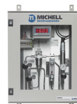
ES20 Systèmes d'Échantillonnage

Michell Instruments a adopté un programme de développement continu qui nécessite parfois des modifications sans préavis. Publication n° : MDM300_97156_V9.5_FR_0223