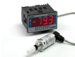
Easidew Online Hygromètre à Point de Rosée